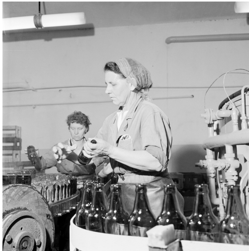
Kuva: Kaksi Kotkan höyrypanimon työntekijää tyhjiä pulloja kuljettavan linjastonäärellä. Kotka 1960, valokuvaaja tuntematon. Kuluttajaosuuskuntien keskusliiton (KK) kokoelma, Suomen valokuvataiteen museo.

Hankkeen tulokset kootaan myöhemmin museon verkkosivuille kaikkien vapaasti hyödynnettäväksi.