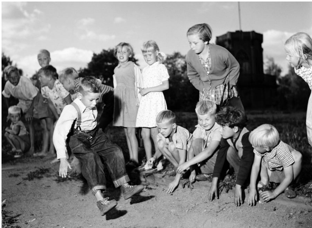
Kuva: Lapsia hyppäämässä pituutta Osuusliike Elannon kesäsiirtolassa Sompasaaressa. Helsinki, 1955, valokuvaaja tuntematon. Kuluttajaosuuskuntien keskusliiton (KK) kokoelma, Suomen valokuvataiteen museo.