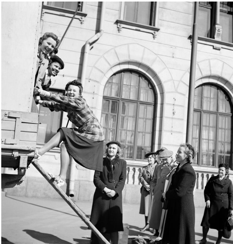
Kuva: Kulutusosuuskuntien Keskusliiton työntekijöitä lähdossa virkistysretkelle. Helsinki, 1943, valokuvaaja tuntematon. Kuluttajaosuuskuntien keskusliiton (KK) kokoelma, Suomen valokuvataiteen museo.

Valtakunnallinen Museoviraston rahoittama innovatiivinen hanke sekä osa Suomen itsenäisyyden satavuotisjuhlavuoden Yhteinen perintö -hanketta.